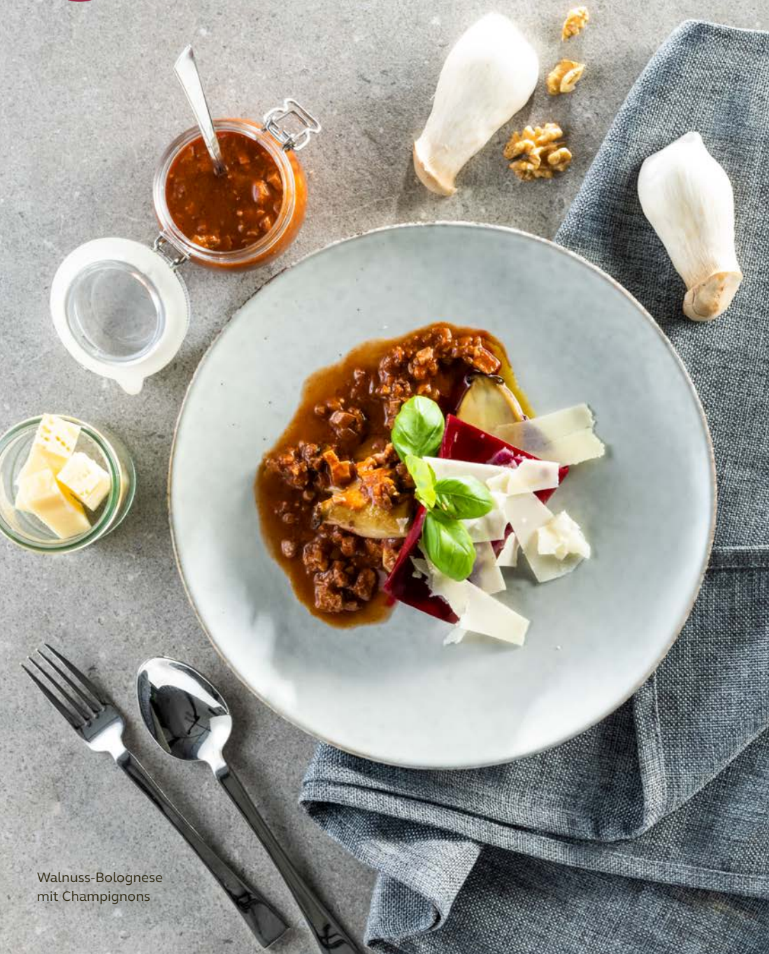
Walnuss-Bolognese mit Champignons

Zusätzliche Belohnung wartet auf Genießer:innen, denn auf den Speisekarten der VeggieWochen befindet sich ein QR-Code zum Gewinnspiel.